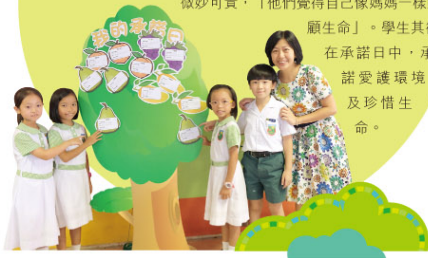
5. 學生承諾實踐綠色生活，活出健康人生。