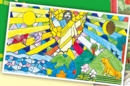
1b. 綽琪在壁畫比賽的原稿。