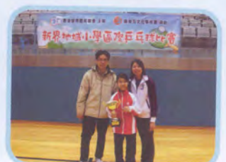
新界地域區際乒乓球比賽 女子團體冠軍