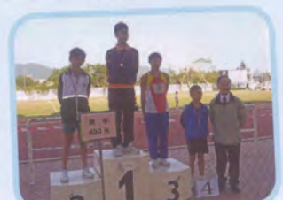
男子甲組四百米亞軍