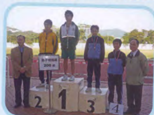
男子特別組二百米冠軍