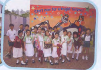
活動：「基礎環保章」訓練講座 日期：2008年11月10日