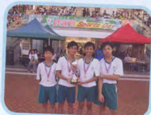
匯知中學接力邀請賽 男子團體冠軍