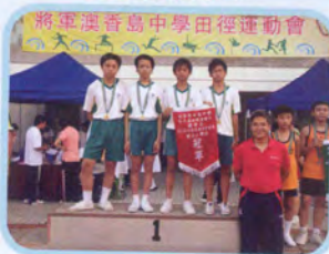
香島中學接力邀請賽 男子團體冠軍