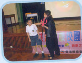
共建健康校園講座

本校在開學至今，已舉辦多個不同類型的講座，能讓同學在一個輕鬆愉快的環境下學習，從而培養同學正面價值觀及人生觀。