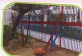
未種植龍柏前學校大閘入口兩旁的情形

為了使學生有一個更舒適的學習環境，本校在2008年5月申請了由康樂及文化事務署舉辦的「2008年綠化校園資助計劃之植樹工程」，並於同年9月獲得康樂及文化事務署批核二萬元的資助款項。本校管理小組成員隨即商討植樹工程實施細則，最後決定於學校大閘入口後方兩側種植二十九棵龍柏，種植工作於2008年11月6日完成。