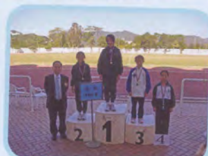
女子丙組一百米跳遠殿軍