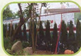
種植龍柏後學校大閘入口兩旁的情形