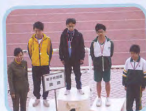
男子特別組跳遠季軍