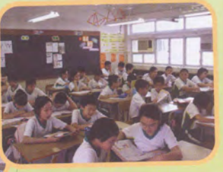
內地優秀教師進行「普教中」示範課。