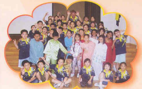
與Admiralty Primary School的同學一起活動。互相認識。他們更交換電郵。保持聯絡呢