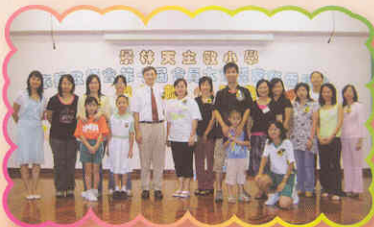
家教會會員大會 第十屆 (24-09-05)

時光飛逝，轉瞬間本學年快將完結。本學年本會舉辦了不同的活動和服務，得到各位家長、教師和常務委員等群策群力，積極協助和參與，使各項均能順利進行，非常感激。現在就讓我們重溫各活動和服務的點滴。