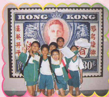
歷史博物館一日遊