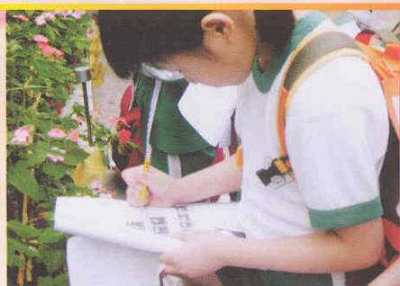
找到答案了!快快寫下來