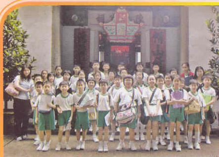
笑一笑!齊來大合照!