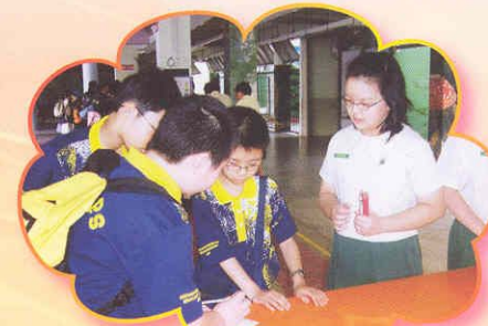
與Greenridge Primary School的同學一起主持攤位遊戲