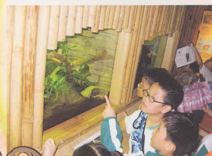
同學們正專注地參觀