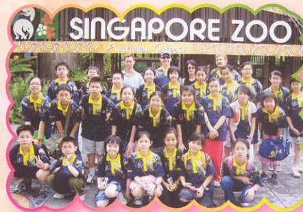
在新加坡動物園前拍照留念