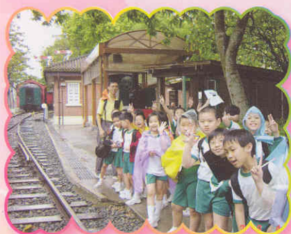
火車來了!要站在一邊嗎?

為了加深學生對大自然、科學與科技及社會的認識，擴闊其知識層面，本校於2006年4月26日安排1-6年級學生參與全方位學習日的活動。是次活動讓學生能走出課室，走進真實環境中學習，吸取課堂外寶貴的學習經驗；並透過實地觀察及參觀來培養學生主動學習及自我探索的精神。另外，參觀地點是配合了常識科相關主題來擬定的，藉此鞏固學生的學科知識，當天的參觀地點如下：