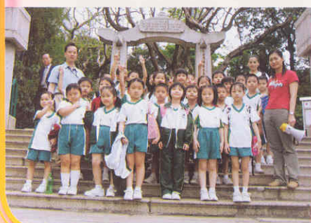
笑一笑!齊來大合照!