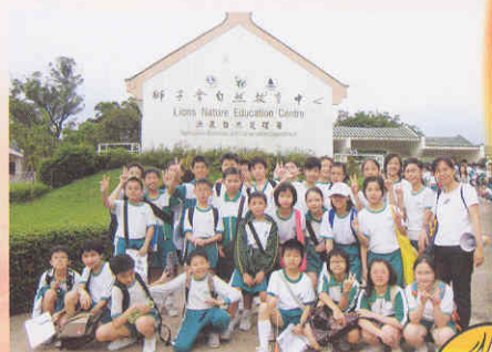
參觀完後歇一會吧!