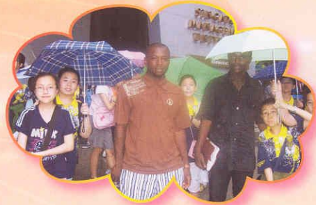
與來自尼日尼亞的朋友合照