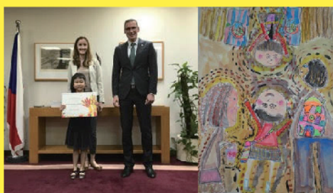
第44屆捷克利迪策國際繪畫展比賽 榮譽獎