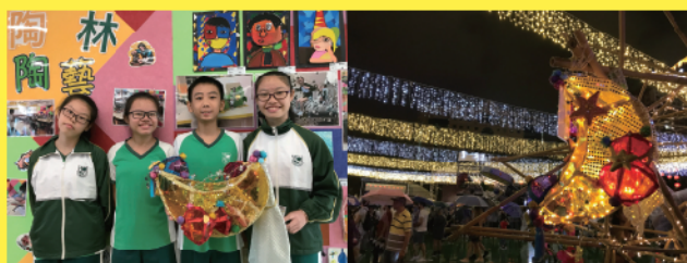
戊戌年維多利亞公園中秋綵燈會「學生綵燈設計展」 月兒添新裝