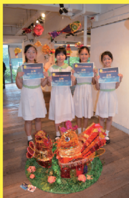
「全港兒童中秋花灯設計比賽」 小學組 金獎、銅獎