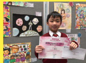
關愛聽障兒童小學生繪畫比賽 優異獎