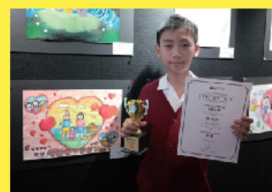
全港才藝兒童繪畫比賽 季軍