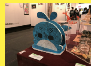
教育局學生視覺藝術作品展 作品於香港大會堂展出