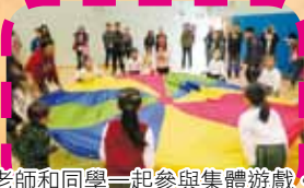
老師和同學一起參與集體遊戲。