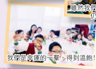
我們是幸運的一羣，得到溫暖！