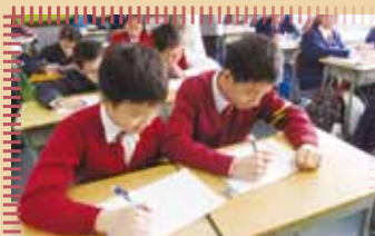
中學英文及數學課都難不倒我們！