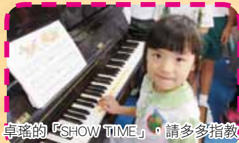
卓瑤的「SHOW TIME」，請多多指教!