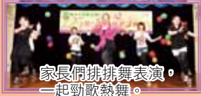
家長們排排舞表演，一起勁歌熱舞。