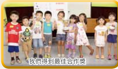
我們得到最佳合作獎