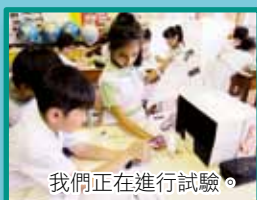
我們正在進行試驗。