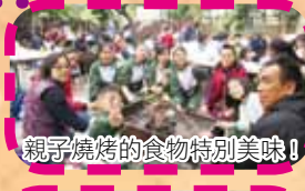
親子燒烤的食物特別美味!