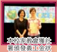
本校家教會獲社署頒發義工金狀