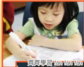
齊齊學習 fun fun fun

為了支援學生學習及培養其自學能力，本校應用 Magic Pen 發展校本學習支援及自學教材，教材涵蓋不同科目（中文、英文、數學、普通話及 Science 科）。