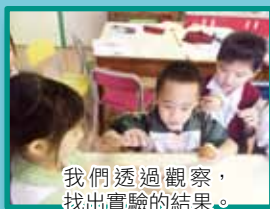
我們透過觀察， 找出實驗的結果。

本校常識科會定期進行科學探究課程，為學生提供多元化的學習經驗。從一個問題開始，啟發學生對日常生活的觀察或科學原理的探求。學生透過親身進行實驗，從而學會推測，估計，試驗，觀察，結果等能力，並能應用科學原理於日常生活中。