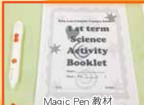
Magic Pen 教材