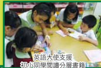
英語大使支援 初小同學閱讀分層書籍