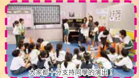
大家都十分支持同學的演出!