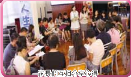
家長們互相分享心得