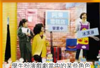
學生扮演戲劇當中的某些角色