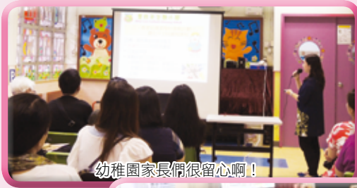
幼稚園家長們很留心啊！