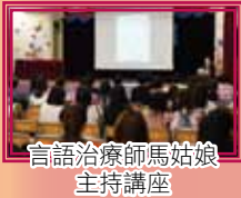
言語治療師馬姑娘主持講座