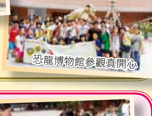
恐龍博物館參觀真開心