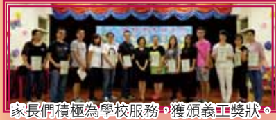
家長們積極為學校服務，獲頒義工獎狀。

日期：2015年11月7日(星期六) 時間：下午 3:00-5:30 內容：主席報告會務、選出新一屆家教會委員、頒發家長義工獎狀、家長教育講座