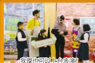
我們也可以上台表演!