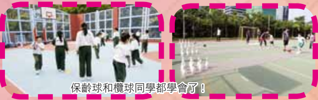
保齡球和檯球同學都學會了!

本年度學校參與了康文署主辦的「我智Fit」健體計劃。此計劃旨在鼓勵學生恆常地參與體育活動，建立活躍及健康的生活模式。活動內容包括：運動示範及同樂、家長講座、體育運動訓練班及體適能測試等。