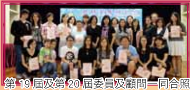
第19屆及第20屆委員及顧問一同合照