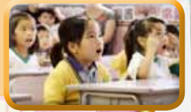
幼稚園參觀本校視藝展