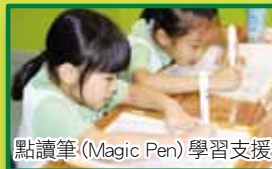
點讀筆 (Magic Pen) 學習支援