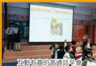
互動有趣的普通話早會

除了「普通話早會」、「普通話學習區」，學校今年更邀請「遊劇場」到校演出，透過生動有趣的互動戲劇表演，提升學生學習普通話的興趣和主動性。