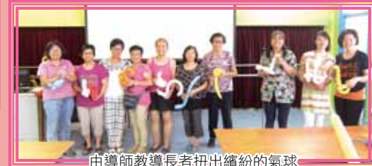
由導師教導長者扭出繽紛的氣球