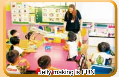
Jelly making is FUN