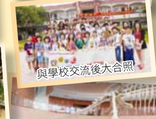
與學校交流後大合照