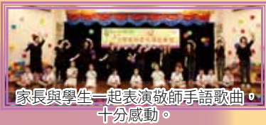
家長與學生一起表演敬師手語歌曲，十分感動。