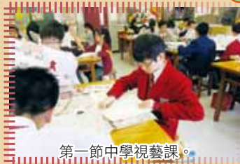
第一節中學視藝課。