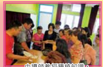
由導師教授種植知識，齊來種植向日葵