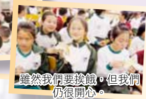
雖然我們要挨餓，但我們仍很開心。