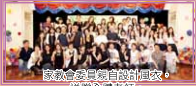
家教會委員親自設計風衣，送贈全體老師。