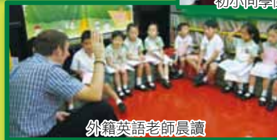
外籍英語老師晨讀