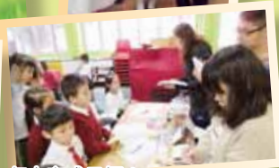
同學們積極參與，努力完成目標！