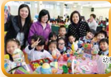
幼稚園同學於英文課設計自己喜歡的玩具