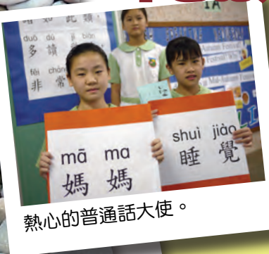
熱心的普通話大使。

為了在學校營造說普通話的氣氛，增加學生接觸普通話的機會，我們繼續以每週四為校園「推普日」，不但早會以普通話進行，而且普通話大使也會於早會和小息跟同學進行對話及遊戲。