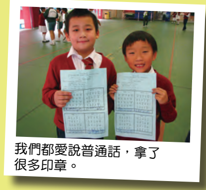
我們都愛說普通話，拿了 很多印章。