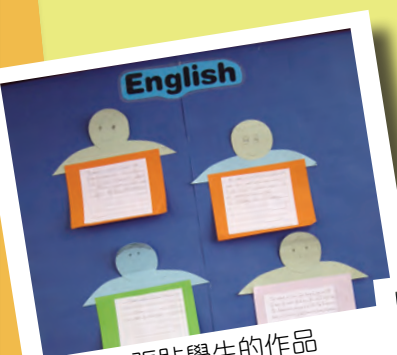
課室內張貼學生的作品及學習成果

本校得到教育局支援，評審及優化學校英文課程。本年度於四、五年級推展，利用多元化的學習材料，將學習、教學及評估結合，為學生提供豐富的學習經驗，提升其英語讀寫聽說的能力。