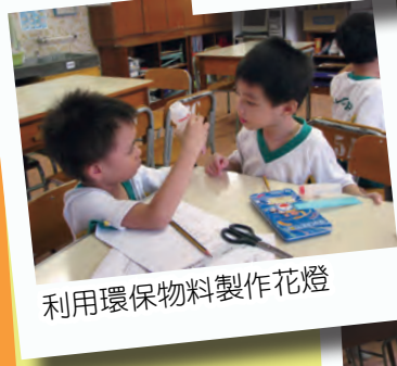
利用環保物料製作花燈