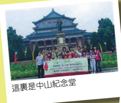
這裏是中山紀念堂