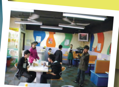
同學們正在拍攝在茶餐廳中發生的一幕片段。