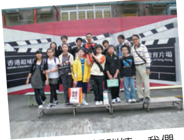
完成一天的拍攝訓練，我們一起合照吧！