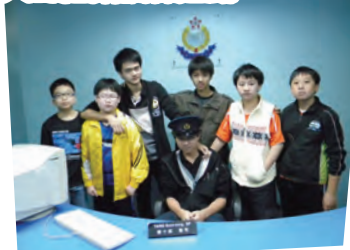
同學們站在片場中的警署，扮演警察。