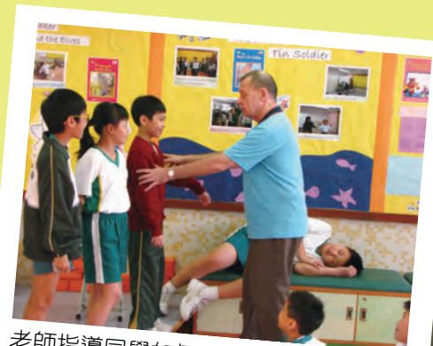
老師指導同學如何進行戲劇活動及即興演出