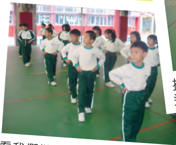
看我們做得多麼神氣