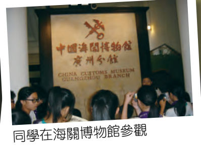
同學在海關博物館參觀