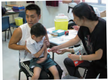
家長義工協助小一生接受疫苗注射