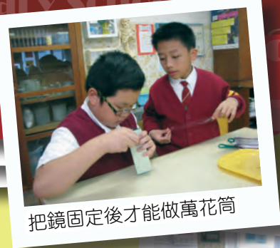
把鏡固定後才能做萬花筒