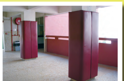
走廊柱位加裝了防撞膠

此外，校方於暑假期間為課室及多間特別室安裝了智能光電白板系統，方便教師在課堂上進行多媒體互動式演示教學。