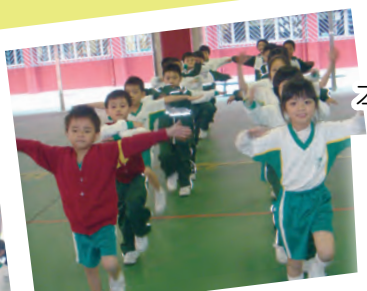
扭扭腰，擺擺手，迎接快樂新一天！