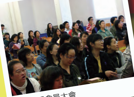
家長會暨會員大會