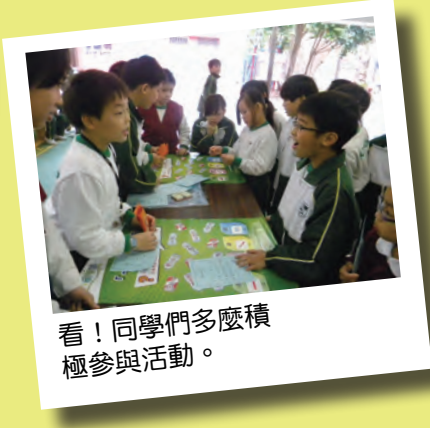
看！同學們多麼積極 參與活動。