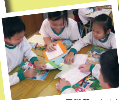
同學們正在小組討論及分享