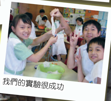
我們的實驗很成功