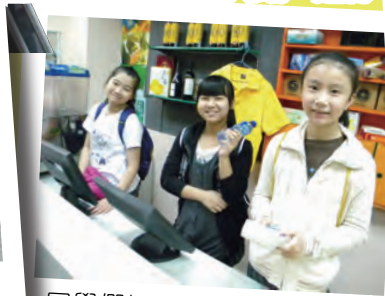
同學們扮演便利店的職員。