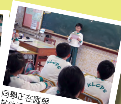
同學正在匯報其他同學用心聆聽