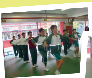
一二、一二，齊齊做早操

本年度學校參與了由香港心臟專科學院舉辦的「跳繩強心」計劃。這計劃將會安排在下學期進行。計劃由四個部份組成：(1)教授跳繩花式；(2)心臟健康教育；(3)舉行籌款活動及(4)舉辦「跳繩同樂日」。希望同學能積極及投入參與這項計劃，並能培養經常做運動的習慣及認識心臟健康的重要性。