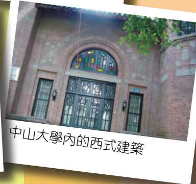
中山大學內的西式建築