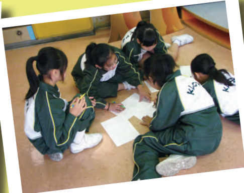
同學進行小組活動