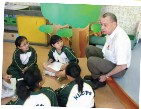
外籍英語老師為同學分享故事

本校英語戲劇課為學生提供愉快的學習環境，培養學生的自信心及提升英語表達能力。老師透過不同的戲劇元素及活動，提高學生對學習英文的興趣。