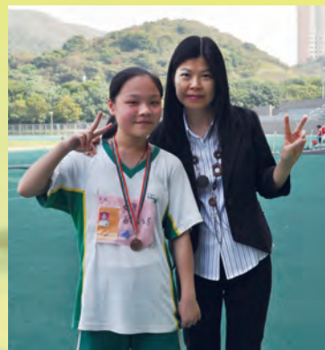
校長與得獎學生合照

近年，「景天」著力發展校本課程，例如：英語戲劇課、以普通話教授中文、科學探究課等，都能適當及有效地協助學生學習，發展各方面的知識，這也是「景天」與其他學校有別之處。從「景天」孩子的表現及成績顯示，他們在各方面的學習也大有進步，同時也引證學校的發展方向是正確的。「景天」會繼續優化學校的校本課程，以提供「景天」孩子最優質教育為我們的目標和使命。