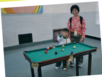
祖母與孫兒一起開心地玩桌球!