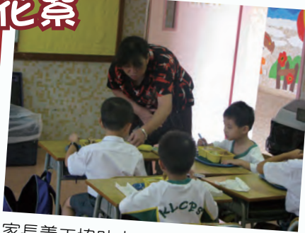
家長義工協助小一生進行午膳