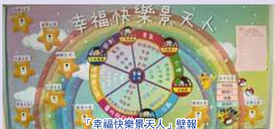
「幸福快樂景天人」壁報

課室外設置「幸福快樂景天人」壁報，鼓勵同學互相發掘、欣賞彼此的美德及性格強項，營造出正向的校園文化。