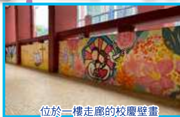
位於一樓走廊的校慶壁畫

為慶祝景天三十周年校慶，本校舉辦親子壁畫設計比賽。學生在壁畫中表達愛德及在景天愉快的校園生活，展現無窮創意。老師和學生在本校一樓走廊共同創作壁畫，在牆壁畫上每一筆畫的色彩，為校園展開新的一面。