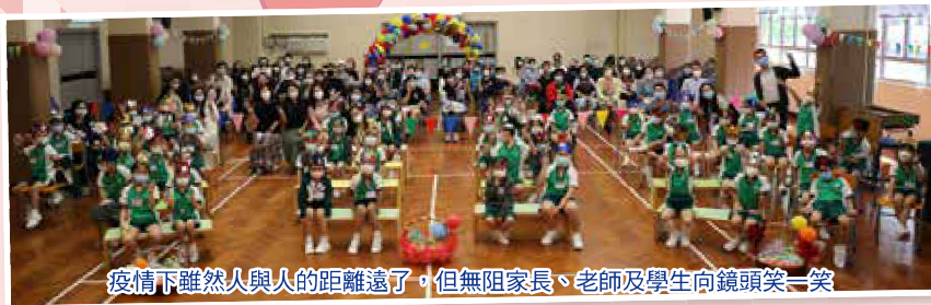
疫情下雖然人與人的距離遠了，但無阻家長、老師及學生向鏡頭笑一笑