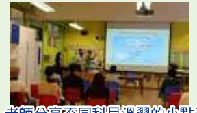
老師分享不同科目溫習的小點子