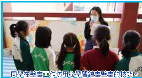
同學在壁畫工作坊用心學習繪畫壁畫的技巧。