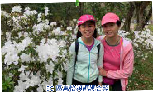
5C 區惠怡與媽媽合照