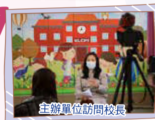
主辦單位訪問校長