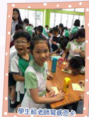
學生給老師寫感恩卡