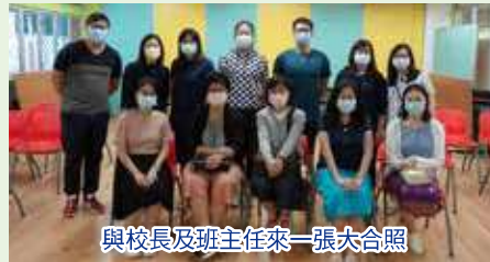
與校長及班主任來一張大合照

我們定期舉辦小一家長「茶聚」，一方面讓家長了解子女在校的生活，另一方面有機會與班主任溝通交流，希望加強家校之間的溝通和互動，達致更緊密的聯繫。