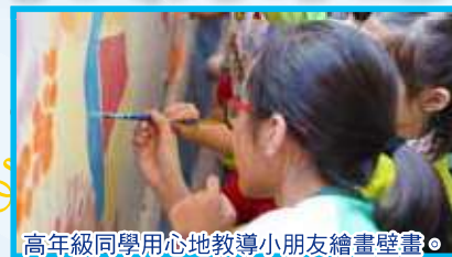
高年級同學用心地教導小朋友繪畫壁畫。